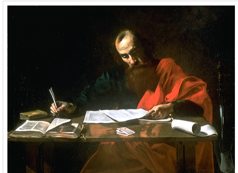
Pablo de Tarso escribiendo sus cartas, obra del siglo XVII