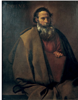
Saulo o San Pablo, el Apóstol de las Gentes. Cuadro de Velázquez.